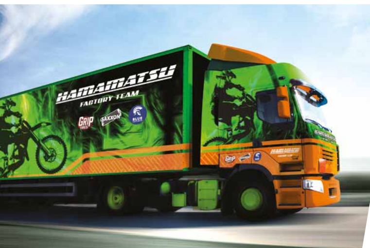
COVERINGS DE VÉHICULES