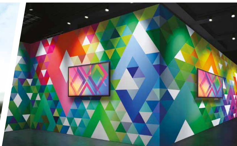
STANDS ET PLV