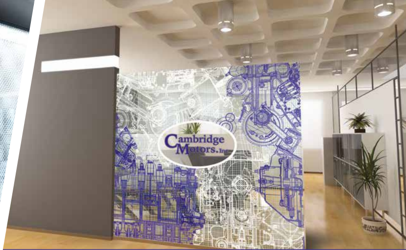
DÉCORATIONS DE VITRINES